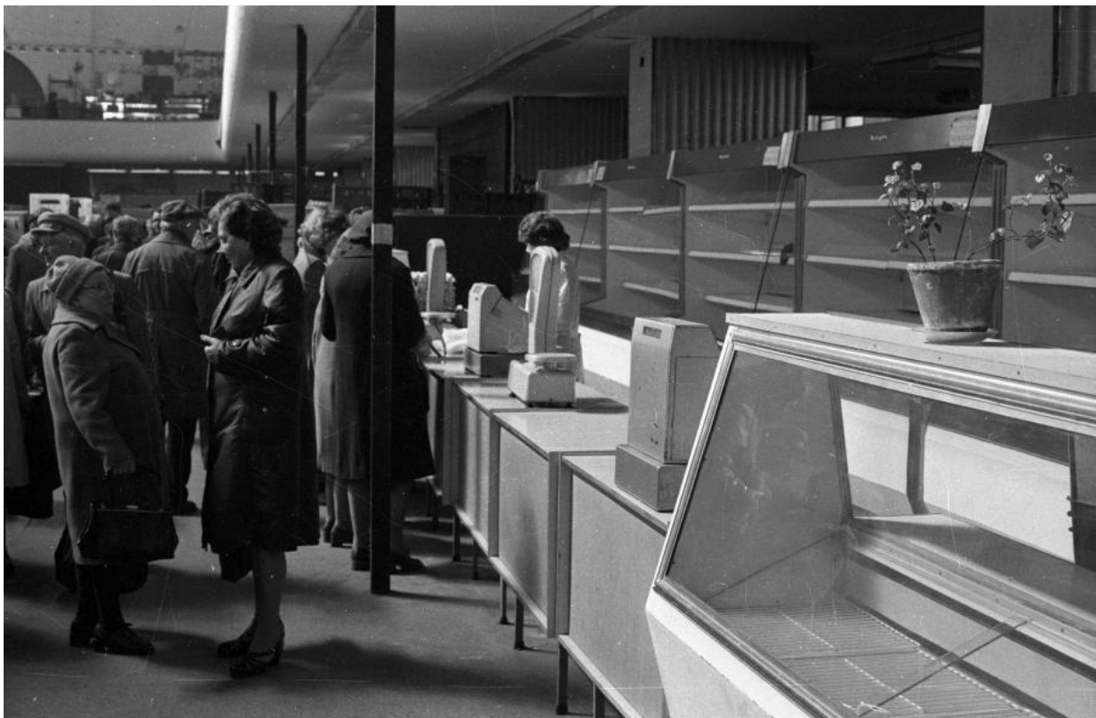
Sklep mięsny z czasów PRL.

W 1956 r. I sekretarzem PZPR został Władysław Gomułka. Polska odbudowywała się powoli ze zniszczeń wojennych i sytuacja w kraju zaczęła się poprawiać i stabilizować. Społeczeństwo miało coraz większy dostęp do sprzętu gospodarstwa domowego, mebli, odbiorników radiowych, a potem też telewizorów. Dzięki industrializacji i elektryfikacji tworzono nowe miejsca pracy w przemyśle. Budowano coraz więcej (choć nadal zbyt mało) mieszkań, rozbudowywano system przedszkoli i szkół (w latach 60. w ramach programu o nazwie „1000 szkół na tysiąclecie państwa polskiego” zbudowano ponad 1200 szkół podstawowych). Okres ten nazywa się małą stabilizacją . Mimo to polska gospodarka, oparta na centralnym planowaniu i ingerencji państwa, była niedoinwestowana i zacofana, a od połowy lat 60. stawała się coraz bardziej niewydolna. W 1970 r. zaistniała konieczność wprowadzenia dużych podwyżek cen żywności. Wywołało to protesty społeczne na Pomorzu, a do ich tłumienia władze skierowały wojsko, które otworzyło ogień do robotników. W wyniku tych wydarzeń Gomułka stracił władzę. Nowym I sekretarzem KC PZPR został Edward Gierek .