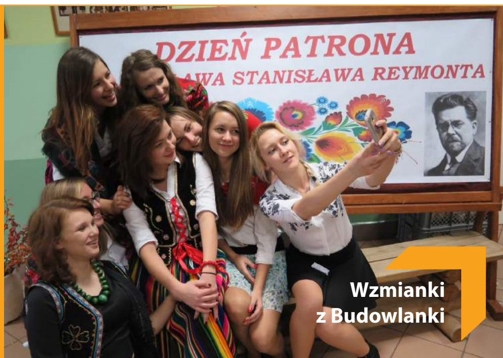
Wzmianki z Budowlanki