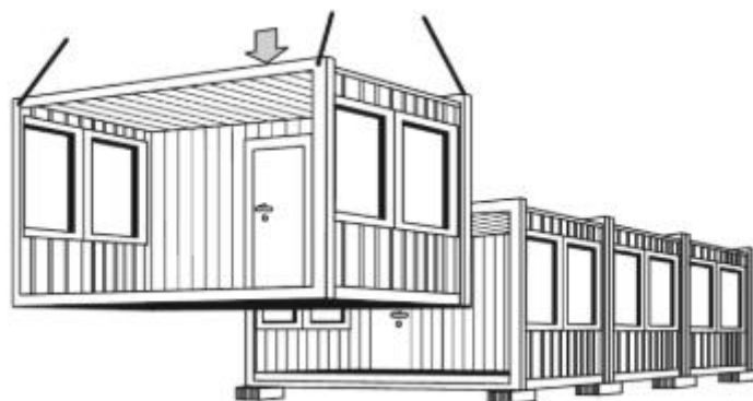
Budynek administracyjno- socjalny zestawiany z kontenerów