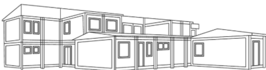
Dwukondygnacyjny budynek adminstracyjno – socjalny