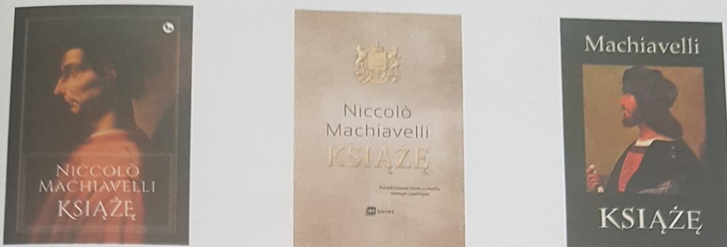
Rys. 2. Pierwsze strony okładki rozprawy Książę Niccolò Machiavellego, znanej również pod tytułem Traktat o Księciu

Przed przystąpieniem do projektowania okładki książki warto zobaczyć, jak zrobili to inni, aby nie wyważać otwartych drzwi.