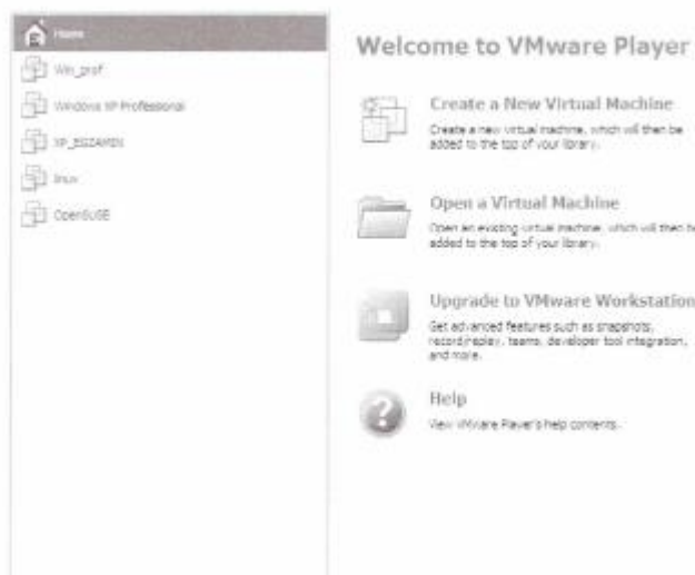
Rysunek 6.233. VMware Player

W celu stworzenia nowej wirtualnej maszyny w głównym oknie programu (rysunek 6.233) należy wybrać kreator tworzenia wirtualnej maszyny ( Create a New Virtual Machine ).