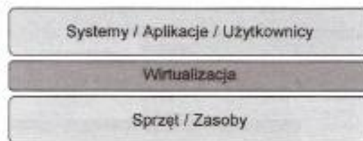
Rysunek 6.222. Schemat wirtualizacji

Oprogramowanie do wirtualizacji pozwala na tworzenie i uruchamianie wirtualnych maszyn z 32- lub 64-bitowym systemem operacyjnym zarówno Windows Linux, jak i innym, takim jak Solaris, FreeBSD czy Novell. Najbardziej popularne oprogramowanie do wirtualizacji to: