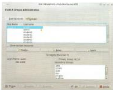
Rys. 14.5. Menadżer użytkowników

W środowisku graficznym istnieje Menadżer użytkowników – wygodne narzędzie do zarządzania użytkownikami i grupami. Można je uruchomić, wybierając Ustawienia / Ustawienia systemowe . W sekcji Administracja systemu należy wybrać ikonę Menadżera użytkowników (User Management) i w oknie wprowadzić hasło użytkownika z uprawnieniami (rys. 14.5).