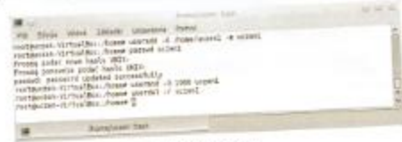
Rys. 14.4. Zarządzanie użytkownikami w trybie tekstowym

Na rysunku 14.4 pokazano polecenia wykorzystywane do zarządzania użytkownikami.