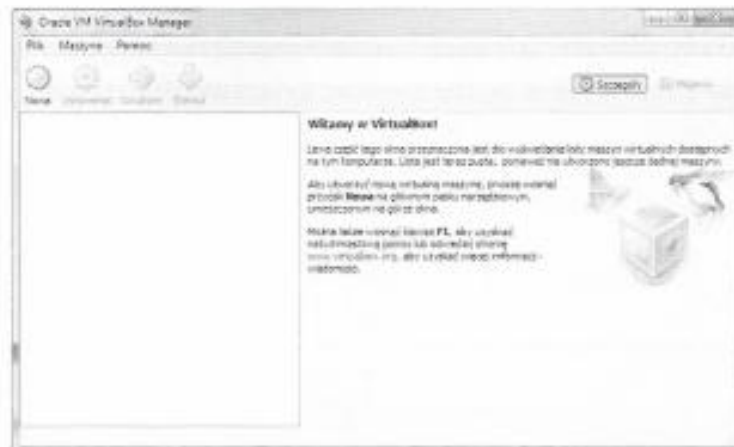
Rysunek 6.239. Główne okno programu VirtualBox

Instalację nowej maszyny należy rozpocząć od określenia nazwy nowo tworzonej wirtualnej maszyny oraz rodzaju i wersji systemu operacyjnego, który będzie instalowany (rysunek 6.240).