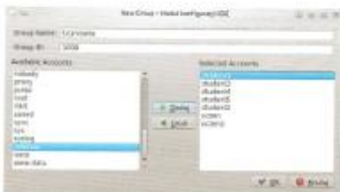
Rys. 14.9. Dodawanie nowej grupy

Aby dodać nową grupę, należy w Menadżerze użytkowników kliknąć zakładkę Grupy (Groups) i w oknie dodawania grupy podać jej nazwę, identyfikator i ewentualnie wskazać członków (rys. 14.9).