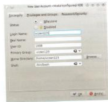
Rys. 14.6. Szczegóły dodawanego konta

Aby za pomocą Menadżera użytkowników dodać nowe konto, należy kliknąć przycisk Nowy , a następnie określić właściwości tworzonego konta. Na rys. 14.6 przedstawiono szczegóły dodawanego konta.