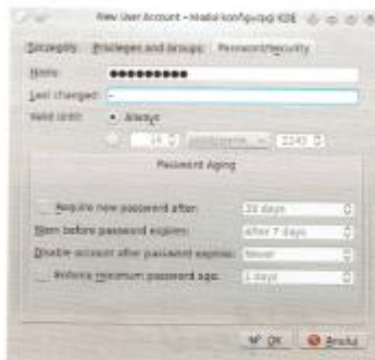
Rys. 14.8. Szczegóły dotyczące hasła dodawanego konta

Na rys. 14.8 przedstawiono szczegóły dotyczące hasła dodawanego konta.