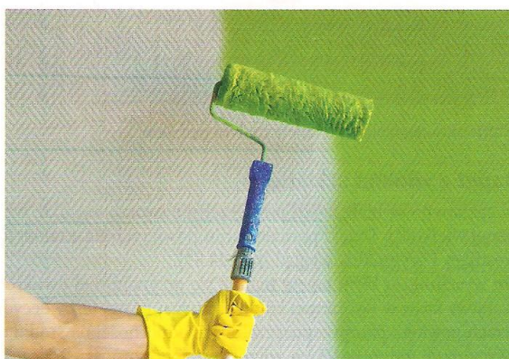
Rys. 24.60. Nakładanie wierzchniej warstwy farby na tapetę z włókna szklanego

W łazienkach można zastosować tzw. farbę lateksową, dobrze wchłanianą przez tapety i podkreślającą ich fakturę. Farba lateksowa sprawia, że tapeta zyskuje właściwości wodoodporne, jednak niektóre farby tego rodzaju blokują przepływ pary wodnej. Jeżeli w łazience nie ma sprawnej wentylacji, prowadzi to do rozwoju grzybów i pleśni na powierzchni ścian i suficie.