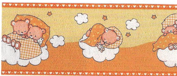
Rys. 24.63. Border

Przykleja się je pod sufitem, wokół okien, drzwi i kominków, a także nad krawędzią boazerii. Można też obramować nimi powieszony na ścianie obraz lub utworzyć z nich niezależną ozdobną ramę na powierzchni ściany (rys. 24.64).