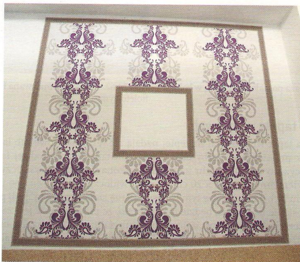
Rys. 24.64. Bordery tworzące obramowania fragmentów ścian