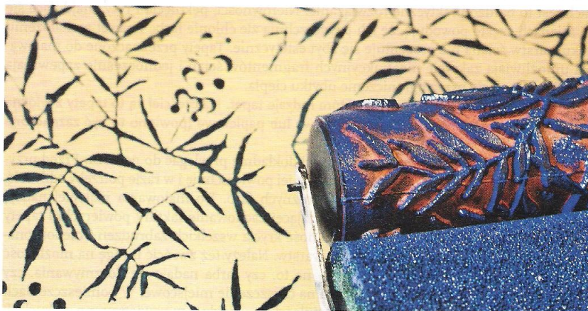
Rys. 24.57. Malowanie tapety wałkiem strukturalnym