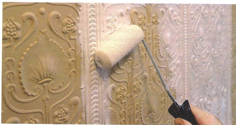
Rys. 24.56. Malowanie tapety wałkiem futerkowym

Malowanie tapet wałkiem przebiega szybciej (rys. 24.56). Jeśli tapeta ma wypukłości, konieczne jest zastosowanie wałka z długim włosiem, dzięki któremu farba może dotrzeć w każde miejsce. Aby wypełnić farbą wszystkie zagłębienia, należy prowadzić wałek najpierw pionowo, a potem ukośnie i na boki. Docisk wałka nie może uszkodzić powierzchni tapet tłoczonych. Tapety gładkie można również malować wałkiem strukturalnym, odciskającym na powierzchni określony wzór (rys. 24.57).