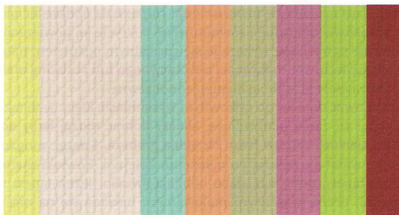
Rys. 24.59. Pomalowana tapeta z włókna szklanego

Do malowania powinno się używać farb, których właściwości oznaczono literami: