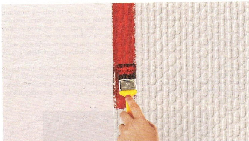
Rys. 24.58. Malowanie skrajnego obszaru tapety małym pędzlem

Zaleca się, aby malowanie kolejnych obszarów tapety rozpoczynać od ich krawędzi. Najpierw powinno się malować krawędzie mniejszymi pędzlami lub wałkami, a potem obszary środkowe – większymi narzędziami. Unika się w ten sposób zabrudzenia farbą obszaru poza tapetą (rys. 24.58). Innym sposobem zabezpieczenia jest oklejenie powierzchni niemalowanych taśmą malarską.