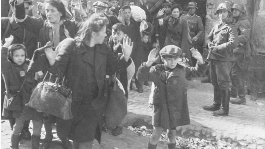
Warszawa, 1943 r. Z płonącego getta wypędzono ostatnich mieszkańców. Nz. Kolumna Żydów w drodze do wagonów, które zawiozły ich do obozów śmierci.

podobnie jak komunizm (m.in. sowiecki system gułagów, wielki głód na Ukrainie wywołany kolektywizacją, polityka Czerwonych Khmerów w Kambodży).