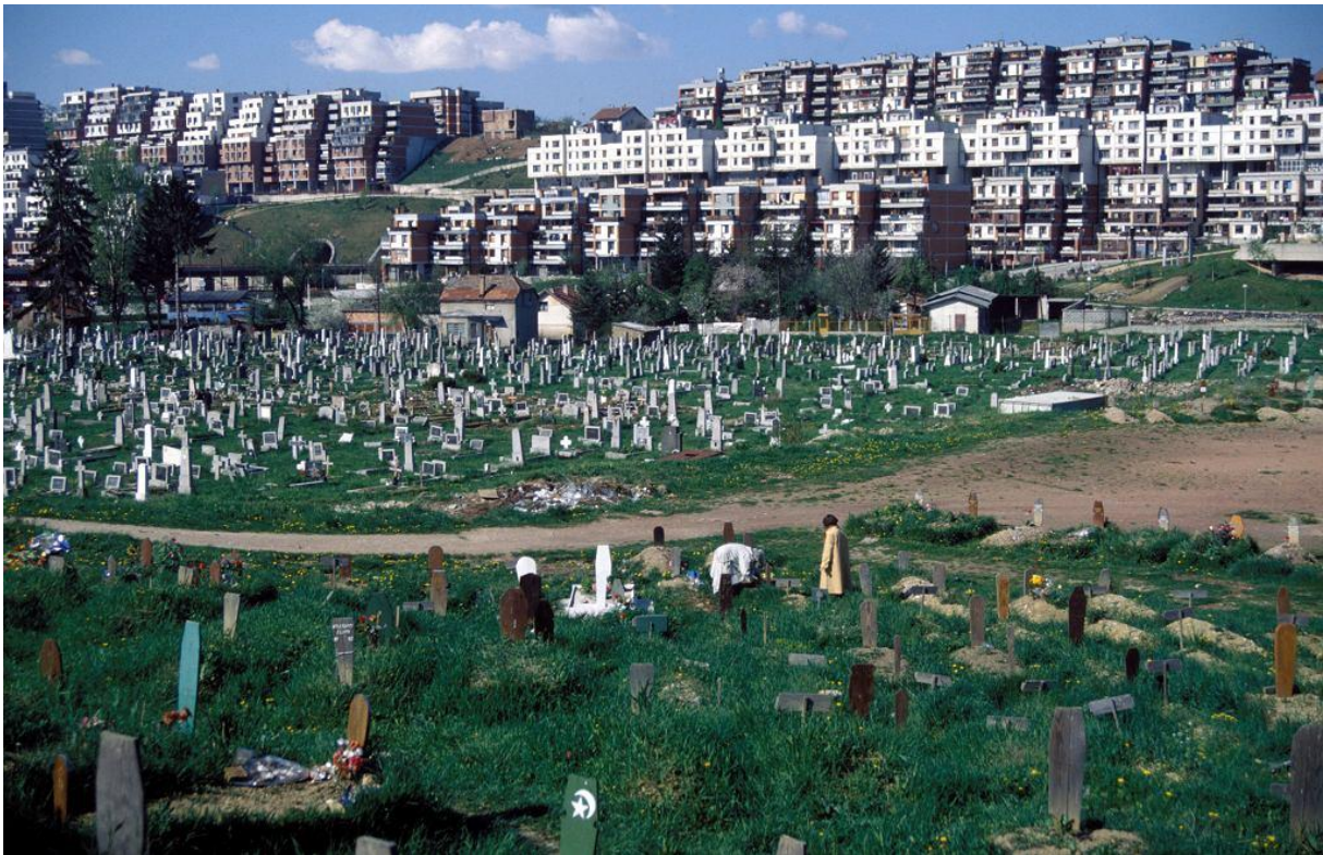
Tereny stadionu olimpijskiego w Sarajewie zamienione na cmentarz w 1995 roku.

W okresach trudności gospodarczych członkowie mniejszości etnicznych czy wyznaniowych są często postrzegani jako konkurenci ekonomiczni dominującej większości, np. odbierający jej miejsca pracy. Nierzadko w ten sposób we Francji czy Niemczech są dziś postrzegani imigranci kurdyjscy, tureccy czy arabscy (choć kilkadziesiąt lat wcześniej, gdy w Europie Zachodniej odczuwano niedobór siły roboczej, rządy tamtejszych państw popierały napływ imigrantów z pozaeuropejskich krajów). Zdarzające się napady na reprezentantów mniejszości lub podpalenia ich domów, organizowane przez radykalne ugrupowania nacjonalistyczne czy neofaszystowskie, są skrajnym, ale na szczęście niezbyt częstym wyrazem takich nastrojów. Z kolei zamieszki, które w ostatnich latach wybuchały na ubogich przedmieściach francuskich miast, były oznaką niezadowolenia tamtejszych mieszkańców - w większości potomków imigrantów przybyłych z Afryki Północnej i Bliskiego Wschodu. Ludzie ci, mimo że urodzili się we Francji, wciąż czują się w społeczeństwie francuskim obywatelami drugiej kategorii. Ich bowiem w największym stopniu dotyka kryzys - bezrobocie i poczucie braku perspektyw na lepszą przyszłość.