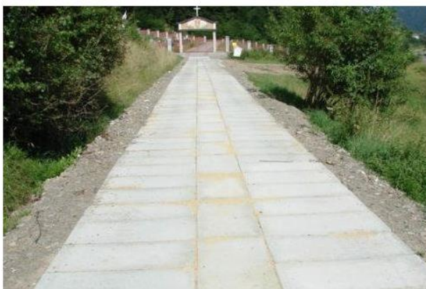
Płyty drogowe pełne.