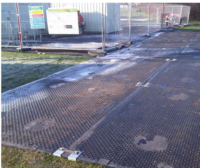
Systemy dróg tymczasowych

Prostota wykonania, użyteczność oraz możliwość wielokrotnego zastosowania to zalety sprawiające, że prefabrykowane płyty zarówno betonowe jak i żelbetowe są najczęściej stosowanymi rozwiązaniami dróg tymczasowych. Układa się je na całej powierzchni drogi lub wyłącznie w pasach pod kołami samochodów. Przykłady: