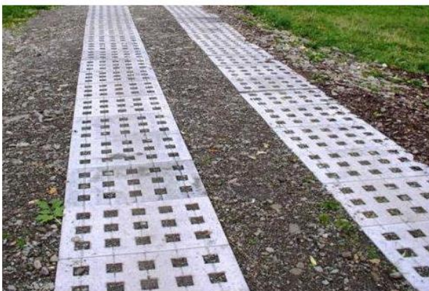
Płyty drogowe ażurowe

a) gruntowe, b) tłuczniowa z kruszywa łamanego, c) grunt stabilizowany spoiwem hydraulicznym