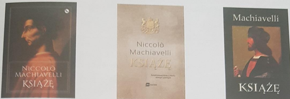
Rys. 2. Pierwsze strony okładki rozprawy Książę Niccolò Machiavellego, znanej również pod tytułem Traktat o Księciu

Przed przystąpieniem do projektowania okładki książki warto zobaczyć, jak zrobili to inni, aby nie wyważać otwartych drzwi.