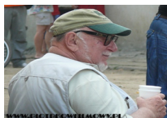
Jerzy Hoffman w Piotrkowie podczas kręcenia filmu „ Bitwa Warszawska ”

2010 – „ Bitwa Warszawska ” Film 3D, w reżyserii Jerzego Hoffmana (ul. Starowarszawska, ul. Farna, pl. Czarnieckiego).