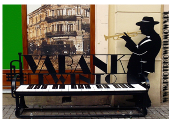
Ławeczka na ul. Sieradzkiej

1982 - „ Vabank ” Komedia w stylu retro, reżyserski debiut Juliusza Machulskiego. (ul. Sieradzka: „Złoty Róg”, Galeria).