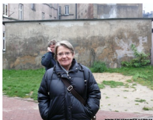
Agnieszka Holland w Piotrkowie podczas kręcenia filmu „W ciemności”

2010 - „ W ciemności ” Film fabularny Agnieszki Holland . (Rynek Trybunalski, ul. Rwańska) .