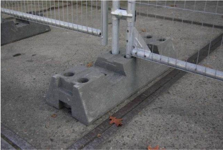
Podstawa do ogrodzeń