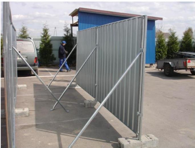
Ogrodzenie typu smart z zastrzałami.

Jednym z popularniejszych systemów ogrodzeń pełnych stalowych są ogrodzenia typu SMART, stosowane powszechnie na budowach, robotach drogowych, itp. Osiągają wysokość do 3m, zabezpieczenie przed wiatrem stanowią podpory boczne